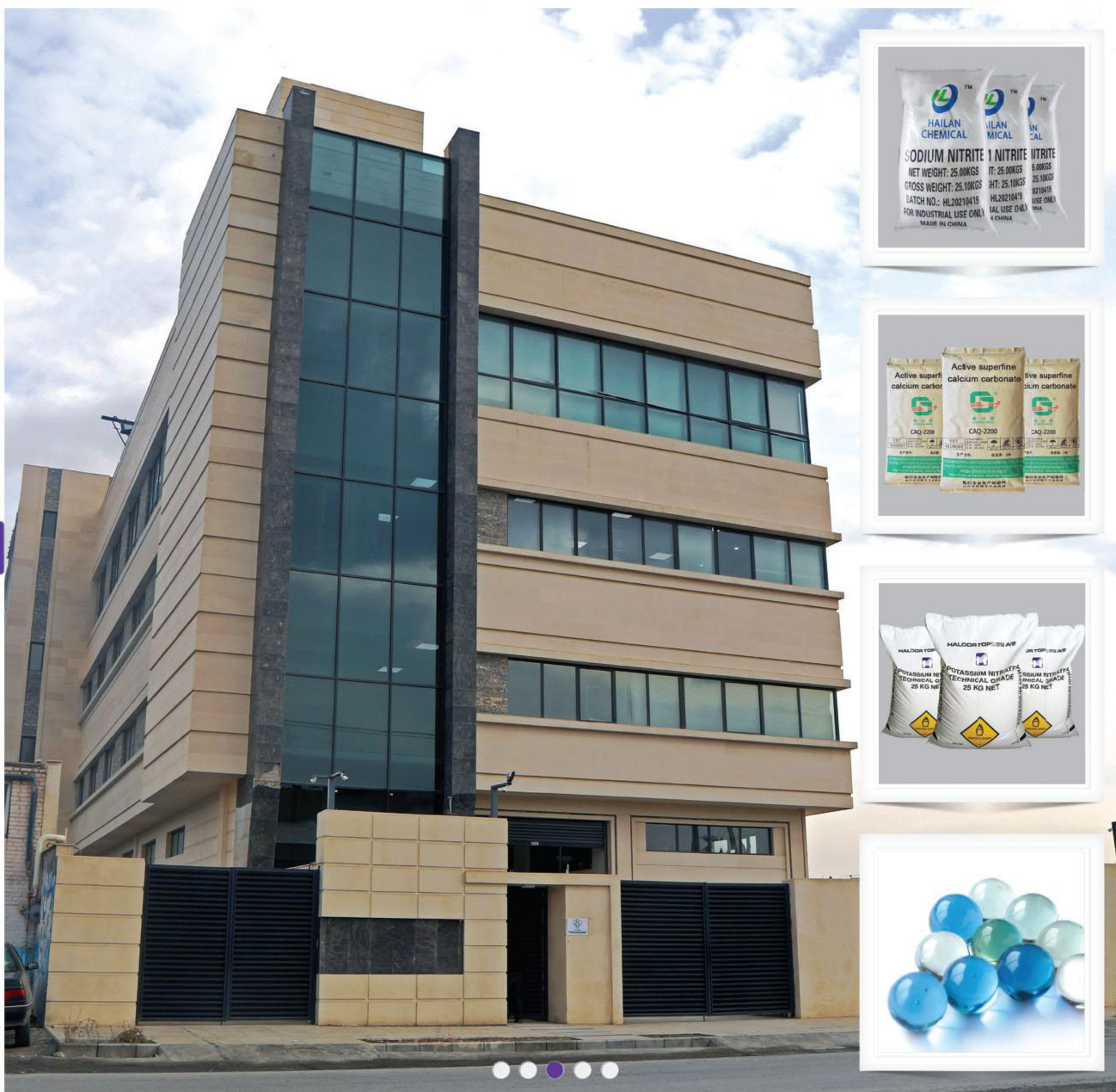
ساختمان مرکزی مهرآزما / شعبه مرکزی